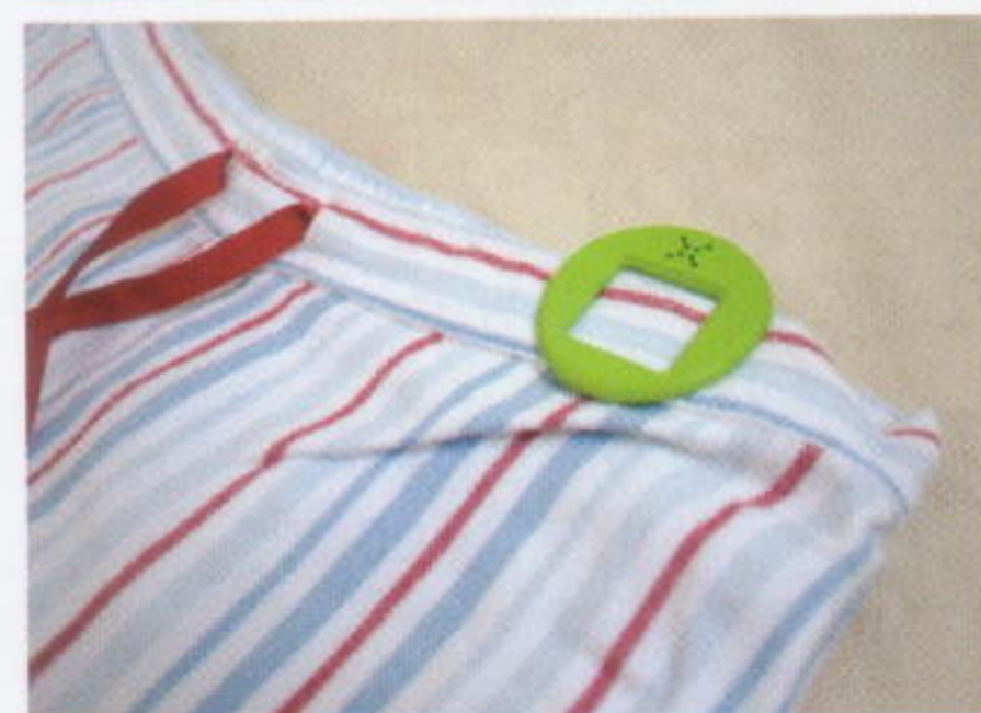
クリップ型なので、パジャマのウエストにつけるだけ。