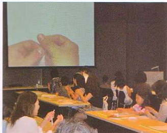
金賞・感性価値デザイン賞: おもしろびじゅつ帖(サントリー)