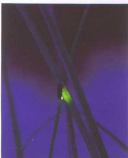
金賞・社会教育デザイン賞:学研ほたるキャンペーン(学習研究社)