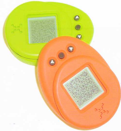
大賞:衣服内温度計「らん'sナイト」(キューオーエル)

8月4日(月)、NPO法人キッズデザイン協議会は、子どもの安全・安心と健やかな成長につながる生活環境の創出や普及、推進を目的とした製品や取り組みを表彰する「キッズデザイン賞」を発表した。第2回目となる今年も、商品デザイン、建築・空間デザイン、コミュニケーションデザイン、リサーチの4部門に寄せられた247件の応募作品の中から、149件の受賞作品を選出した。