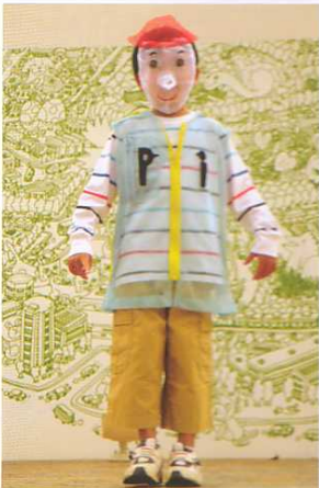
金賞・共創デザイン賞:ピノキオプロジェクト(三井不動産レジデンシャル)