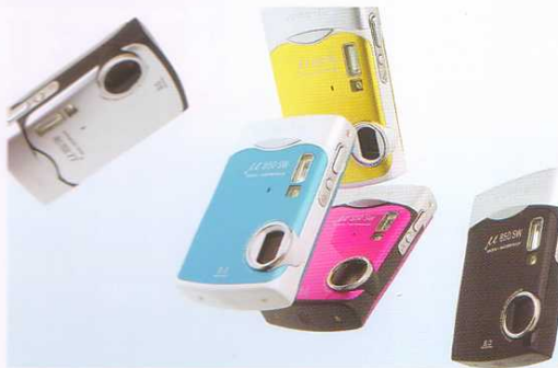
金賞・アクティブデザイン賞:olympus μ 850SW(オリンパス)